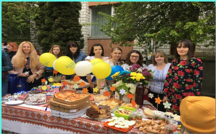
Святковий фестиваль до дня міста