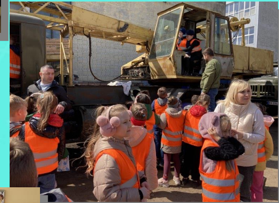
Екскурсія на підприємство